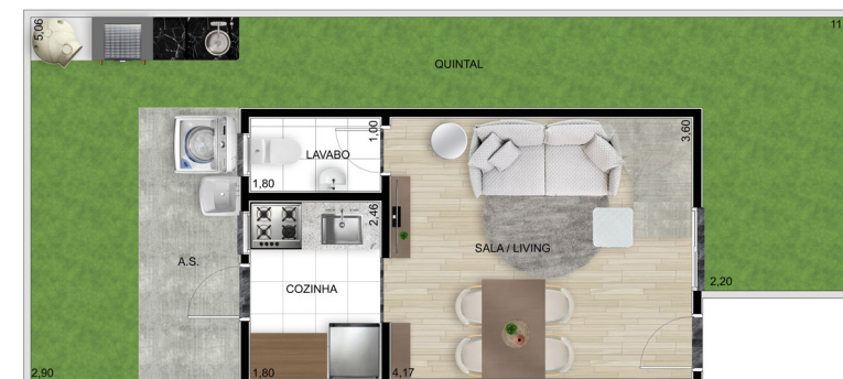
Planta A1 - Inferior

Área coberta: 49,52 m 2 | Varanda: 2,74 m 2 | Jardim privado: 10,84 m 2