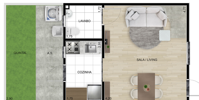
Planta C (Adaptável para PNE) - Inferior

Área coberta: 48,30 m 2 | Varanda: 2,74 m 2 | Jardim privado: 10,58 m 2