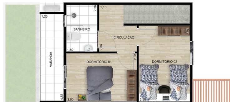
Planta C (Adaptável para PNE) - Superior