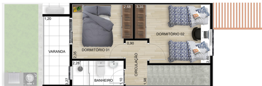
Planta B - Superior