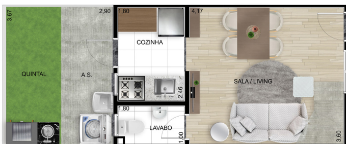
Planta A - Inferior