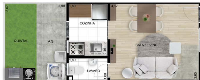
Planta B - Inferior

Área coberta: 48,30 m 2 | Varanda: 2,74 m 2 | Jardim privado: 10,58 m 2