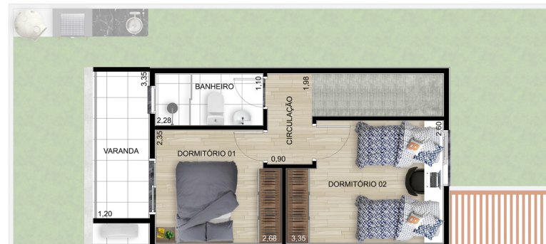
Planta A1 - Superior